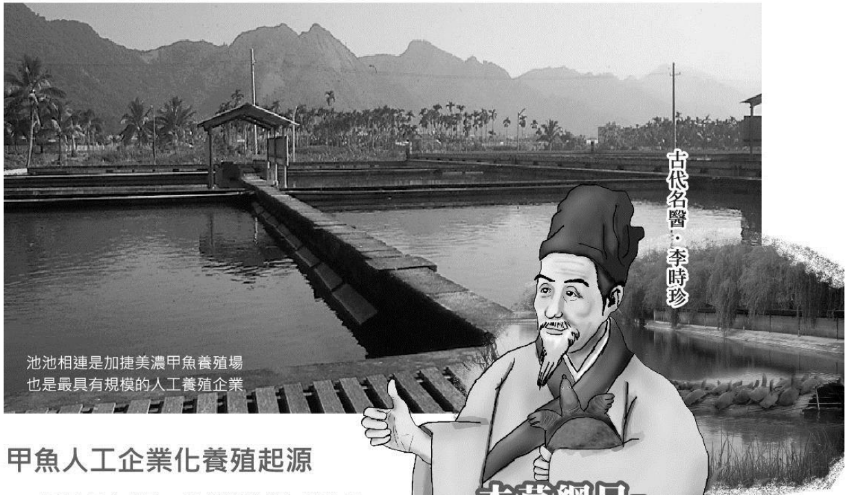
池池相連是加捷美濃甲魚養殖場 也是最具有規模的人工養殖企業