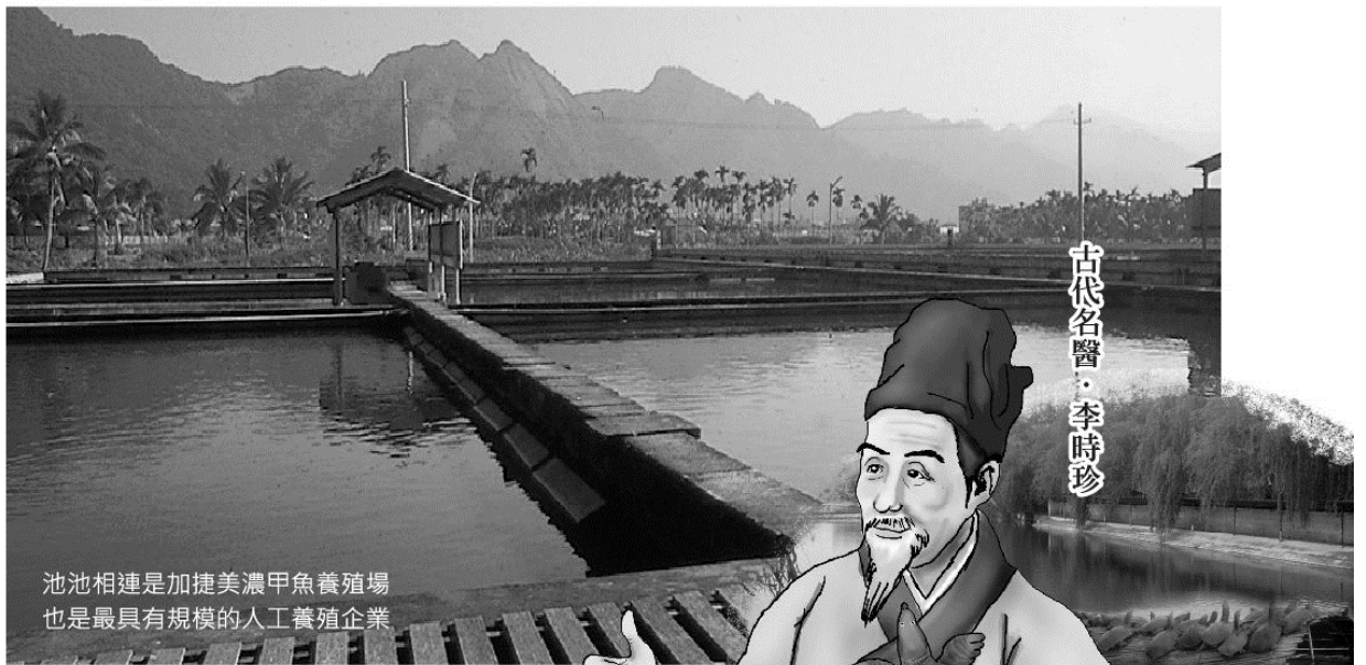
池池相連是加捷美濃甲魚養殖場 也是最具有規模的人工養殖企業