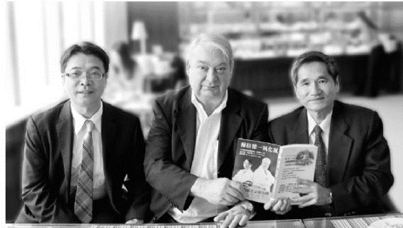
▲陳振興醫學博士(左)、諾貝爾獎得主穆拉德醫學博士(中)、穆拉德加捷鍾祥鳳董事長(右)共同合影

穆拉德加捷公司本著「立足台灣 發揚大中華榮耀全世界」的永續經營精神，分別在2009年於浙江杭州完成甲魚生物科技廠，2010年於上海完成淨水設備製造廠，並於2016年6月，與中國漢皇印象江蘇生物科技股份有限公司，簽訂策略聯盟合作協議，展開一氧化氮和幹細胞，以及中國直銷等項目共營方案，穆拉德加捷公司始終不變的經營理念就是「有方有圓、中規中矩、同心協力、共創未來」，相信很快的未來，穆拉德加捷公司和關係企業，一定會成為全球人際組織服務事業的模範生，感謝大家，也祝福大家平安健康，快樂幸福。